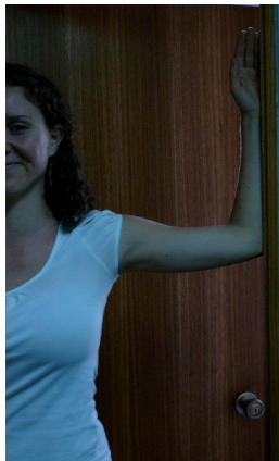
A. 90 grados

Nota: Elongue suavemente y nunca hasta sentir dolor.