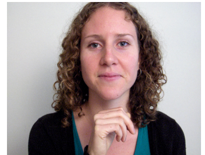
C. Levante la Cabeza