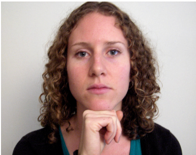
A. Ubicación de la